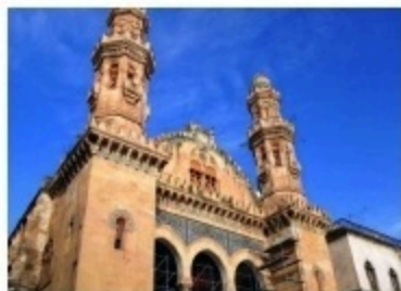
مسجد كتنشواة بالعاصمة و الذي حول الى كنيسة في عهد الاستعمار الفرنسي

السند: 02) (لقد وضعنا أيدينا على أموال الوقف و قضينا على مدارس و مساجد كانت موجودة...)) تقرير لجنة لاسكوتار الفرنسية 1878م