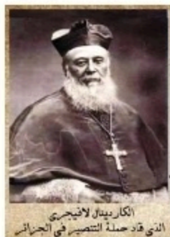
الكاردينال لانيجرى الذي قاد حملة التنصير في الجزائر